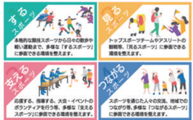
生涯スポーツの振興を4つの観点で体系化します

こうした課題等を乗り越え、成果指標を達成し、区民のスポーツ振興をより推進していくには、スポーツへの導き役である体育協会を始めとしたスポーツ振興団体の存在が不可欠です。同計画では、「スポーツ振興団体による持続可能な「支える」スポーツの推進」も施策の方向性としています。