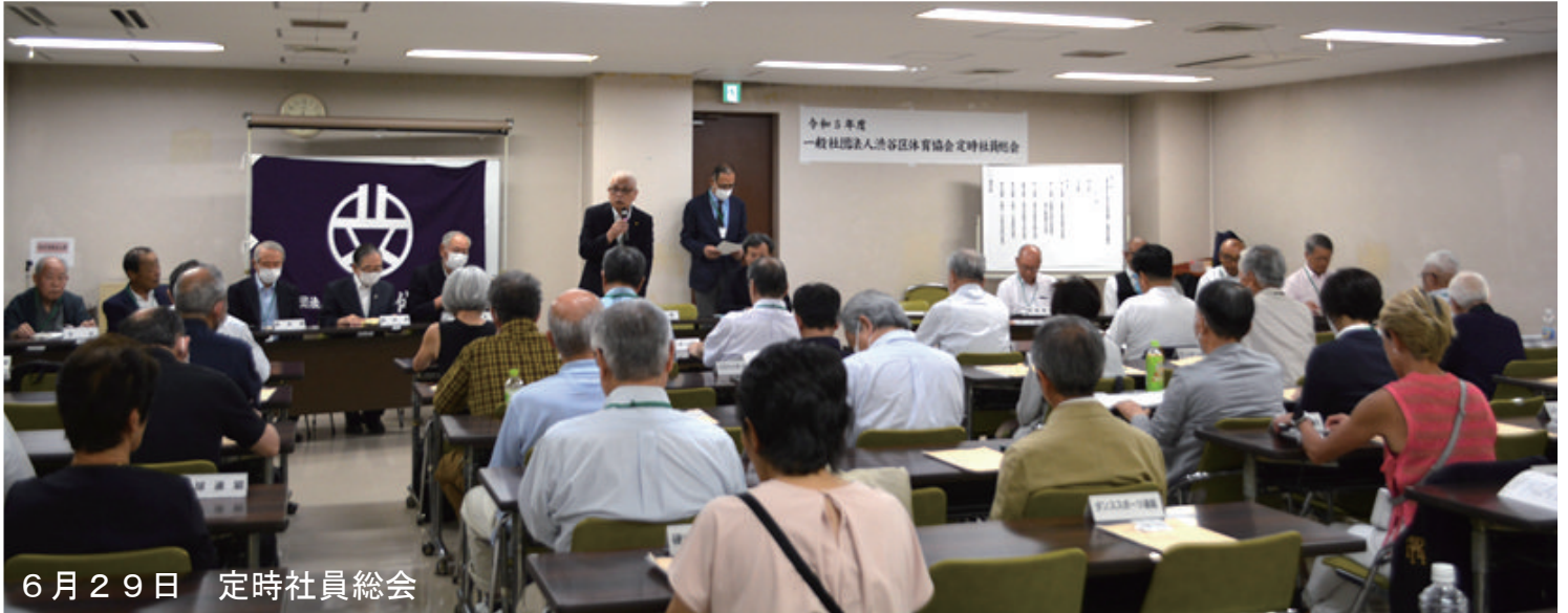
6月29日 定時社員総会